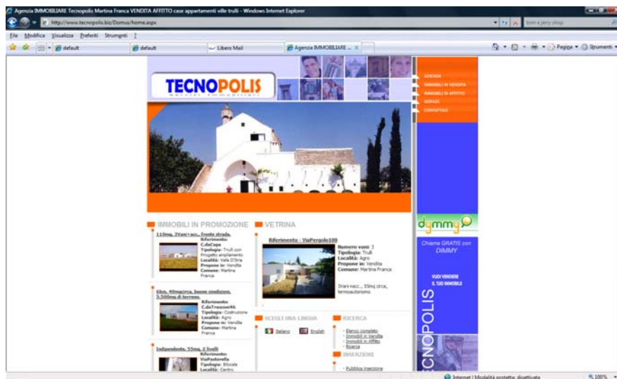
Fig.1 – Front Office: Domus Web

La Progettazione del Sito Web per Agenzia Immobiliare Domus Web si propone come la soluzione completa per le Agenzie Immobiliari che intendono pubblicare le proprie proposte su internet, avere un vero e proprio Gestionale Immobiliare che consente di gestire il proprio archivio immobiliare, clienti, agenti, appuntamenti, note telefoniche, etc.